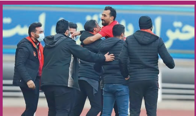
صعود شهر خودرو در جدول با سبقت از سایپا قاسمی‌نژاد فرشته نجات رحمتی