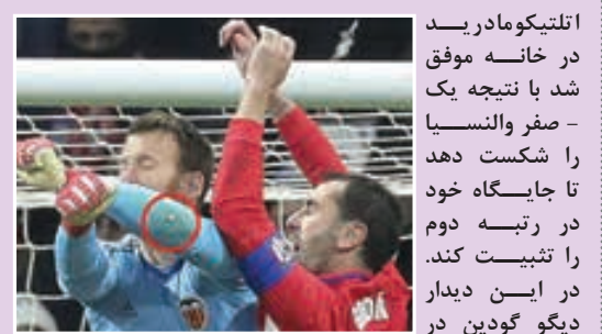
دیگو گویدین در صحنه‌ای با نورتوبرت نتو، دروازه‌بان والنسیا برخوردی داشت. طی این برخورد، دندان این مدافع روی آرنج نتو باقی ماند تا او در دقیقه ۵۱ جای خود را به خوانفران بدهد.