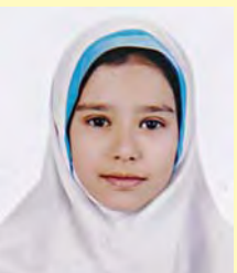
متینبا معینبی پایه پنجم