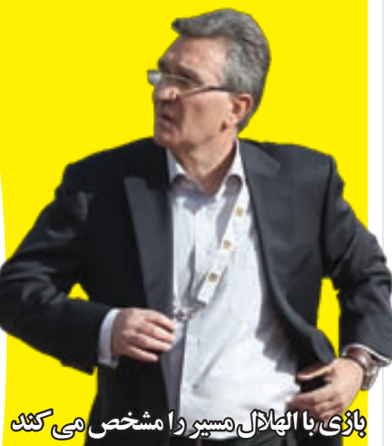
بازی با الهلال هیسو را مشخص می‌کند