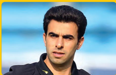
داور مشهوری برترین داور لیگ پانزدهم