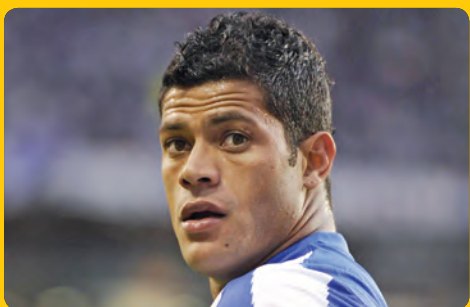
گران ترین نقل و انتقالات تابستان