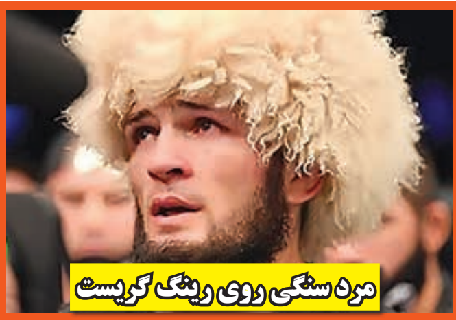
مرد سبکی روی وینک کریست