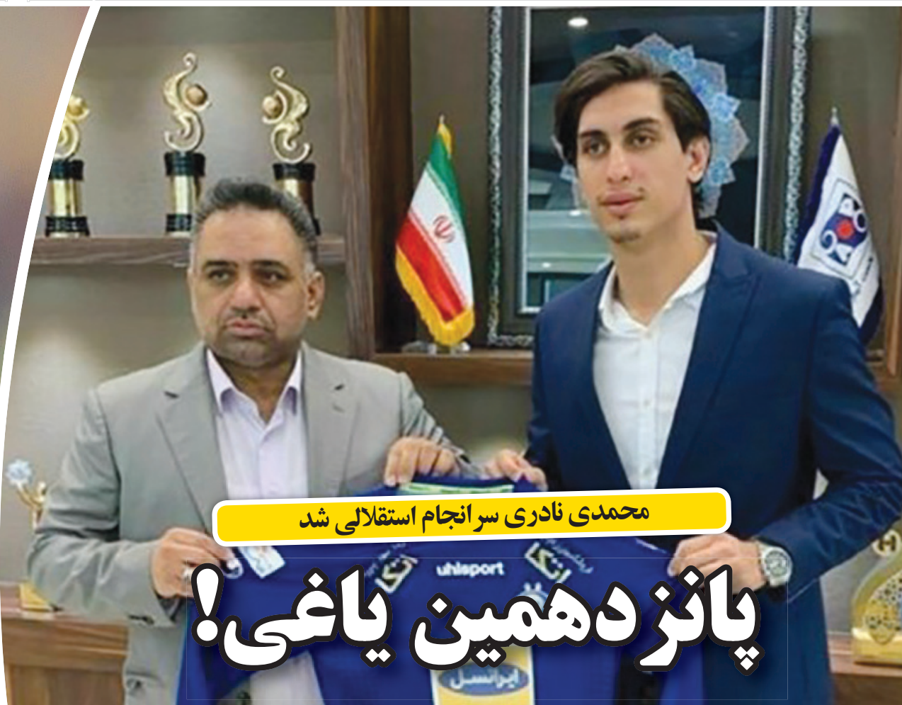
محمدی نادری سرانجام استقالی شد