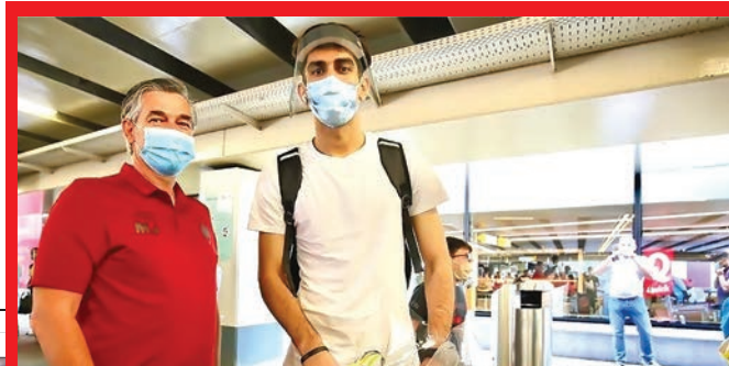
ماجرای جوی جدید شماره یک تیم ملی در اروپا بیراثی با استقبال آتورپی ها و اورد بلژیک شد