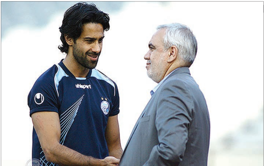
فرهاد فتحی و یوسف اوس

با شیوع ویروس کرونا، واکنش‌ها نسبت به این موضوع و انجام رقابت‌های ورزشی و خصوصا فوتبال طی روزهای اخیر داغ شده است. در اتفاقی جالب توجه یحیی گل محمدی، سرمربی پرسپولیس در شرایطی در نشست خبری دیروز در سالن سازمان لیگ حضور یافت که دستکش بهداشتی برای مراقبت در دست داشت. او در واکنش به سلام اصحاب رسانه و خبرنگاران با گفتن اوس(اصطلاح ورزش رزمی) و با مشت پاسخ آن‌ها را می‌داد. یحیی در واکنش به موضوع شیوع کرونا و لغو نشدن دیدارهای این هفته گفت: «به نظرم باید در این روزهای سخت بیشتر کنار هم باشیم و بیشتر همدیگر را دوست داشته باشیم و به هم اعتماد کنیم. می‌دانیم شرایط سختی بر مردم حاکم است. هر تصمیمی که از بالا گرفته شود ما تبعیت می‌کنیم.»